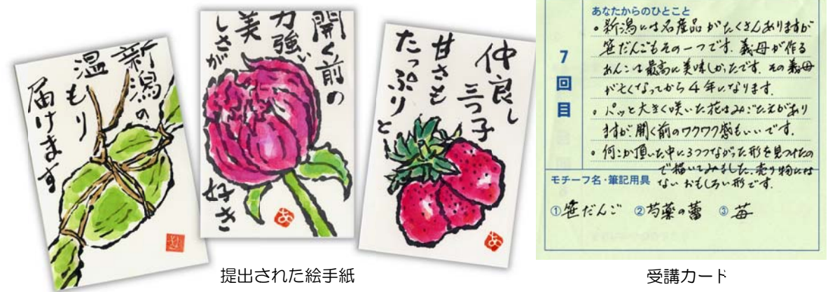
提出された絵手紙